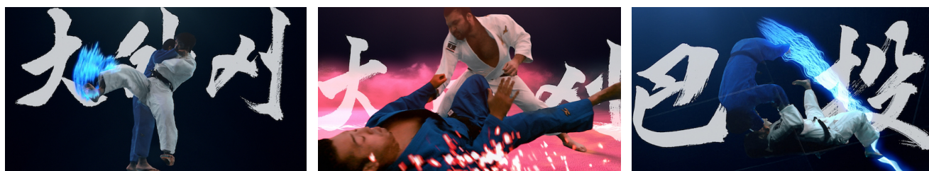
プロモーション動画のイメージ